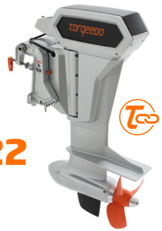
CRUISE 6.0 T/R*